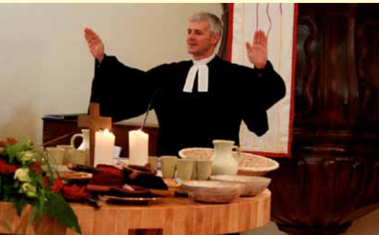
Pfarrer segnet die Gemeinde zum Abschluss eines Abendmahl-gottesdienstes

Bei den Abkündigungen wird gesagt, was im Leben der Gemeinde Bedeutung hat. Informationen über Taufen und Beerdigungen, über Vorhaben und Neuerungen, über Veranstaltungen in der neuen Woche oder den Spendenzweck der Kollekte. Gäste werden begrüßt, Weggehende verabschiedet. „Freut euch mit den Fröhlichen und weint mit den Traurigen“, so sagt es Paulus im Römerbrief (12,15).