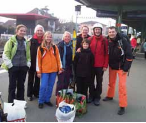
Bunt - fröhlich - generationenübergreifend! - das war der Skitag in Villars

W ir verbrachten einen klasse Skitag in Villars-sur-Ollons am 5. März.