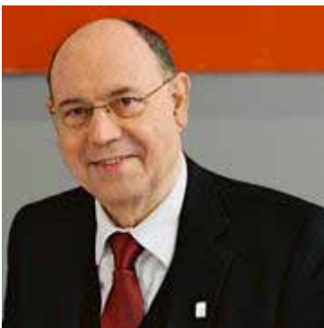
EKD-Ratsvorsitzender Nikolaus Schneider

ließ er die Protestanten wissen: „Den zuständigen Instanzen habe ich inzwischen mitgeteilt, dass in dem Land, in dem die Reformation ihren Ursprung nahm, ein stärkerer ökumenischer Akzent notwendig ist.“ Wie und wo dieser Akzent gesetzt werden soll, ließ der Papst offen. Zugleich bat er um Verständnis, dass in einem „sehr überfüllten Programm nicht alles realisierbar sein wird, was ich selber mir wünschen würde und was dem Gewicht der Sache angemessen wäre“.