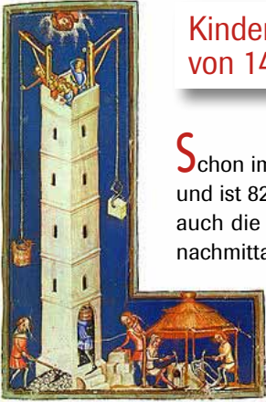
MEISTER DER WELTENCHRONIK, QUELLE: WIKIPEDIA

Kinderbibelnachmittag am 21. Mai von 14 – 17 Uhr in der Kirche