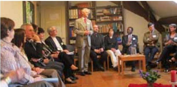
Pfarrer Blessing begrüßt die EKD-Delegation

Es geschieht nicht oft, dass fast der gesamte Rat der Evangelischen Kirche in Deutschland (EKD) eine Ortsgemeinde besucht. Am 6. April empfing die Lutherische Kirche Genf eine EKD-Delegation unter Leitung des Ratsvorsitzenden der EKD Präses Nikolaus Schneider.