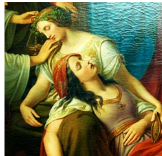
Friedrich Wilhelm Schadow: Die klugen und törichten Jungfrauen

Der Ewigkeitssonntag ist in der evangelischen Kirche ein Gedenktag für die Verstorbenen. Er ist der letzte Sonntag vor dem ersten Advent und damit der letzte Sonntag des Kirchenjahres.